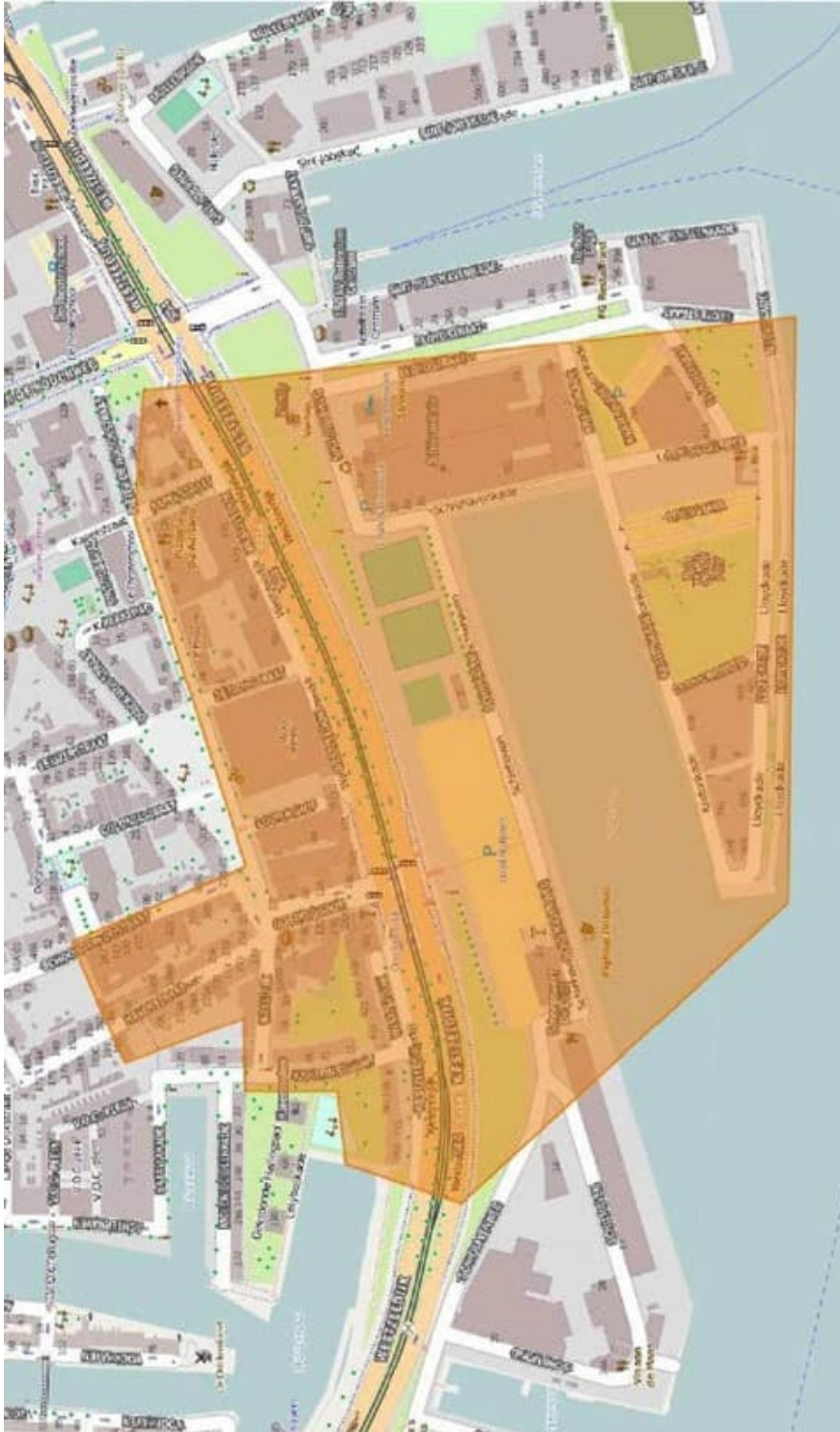
Figuur verspreidingsgebied bewonersbrief